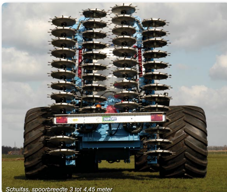
Schuifas, spoorbreedte 3 tot 4,45 meter

De Duport Liquiliser is speciaal ontwikkeld voor het injecteren van hoogwaardige vloeibare kunstmeststoffen. Ook de injectie van bijvoorbeeld insecticiden en herbiciden of water is mogelijk. De Liquiliser bestaat uit een stevig frame met spaakwielen. Via de holle pennen van de spaakwielen wordt de vloeistof op de juiste diepte in de bodem gebracht.