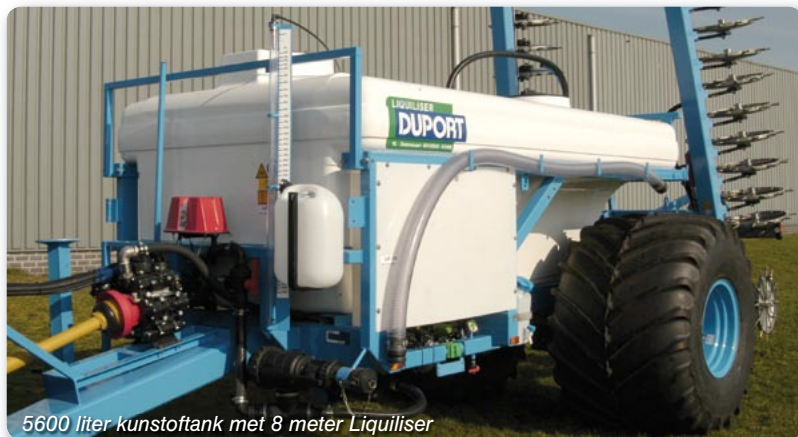
5600 liter kunstoftank met 8 meter Liquiliser

** driedelig frame met drie secties *** vijfdelig frame met vier secties