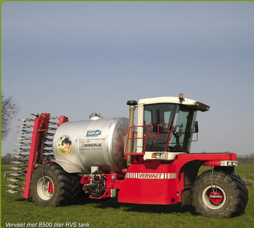
Vervaet met 8500 liter RVS tank

De Duport Liquiliser kan voor iedere gebruiker op maat worden samengesteld. De standaard werkbreedtes zijn 2,3 meter voor de toepassing in de groensector en 4,5 tot en met 12 meter voor landbouwdoeleinden. De injectiepijpen hebben een lengte van ca. 8 cm en zijn geschikt voor bouwland, grasland en recreatiegrassen. De Liquiliser is leverbaar als losse injecteur of in combinatie met speciaal ontwikkelde tankwagens in RVS- en kunststofuitvoeringen. Zowel in getrokken als zelfrijdende uitvoering.