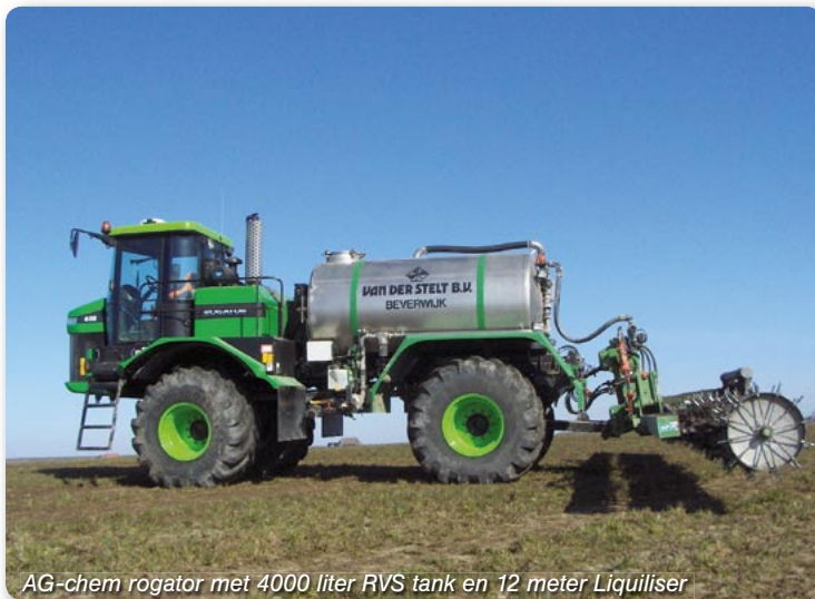
AG-chem rogator met 4000 liter RVS tank en 12 meter Liquiliser