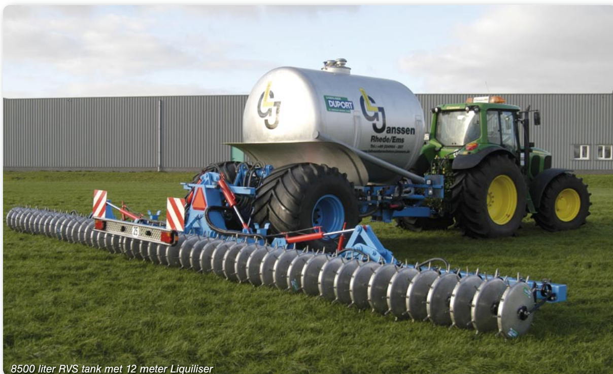
8500 liter RVS tank met 12 meter Liquiliser